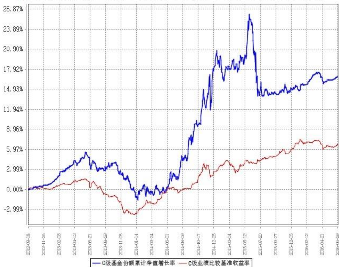
C级基金份额累计净值增长率与同期业绩比较基准收益率的历史走势对比图

注：1、本基金基金合同生效日为2012年9月18日，基金合同生效日至本报告期末，本基金生效时间已满一年。图示日期为2012年9月18日至2016年6月30日。