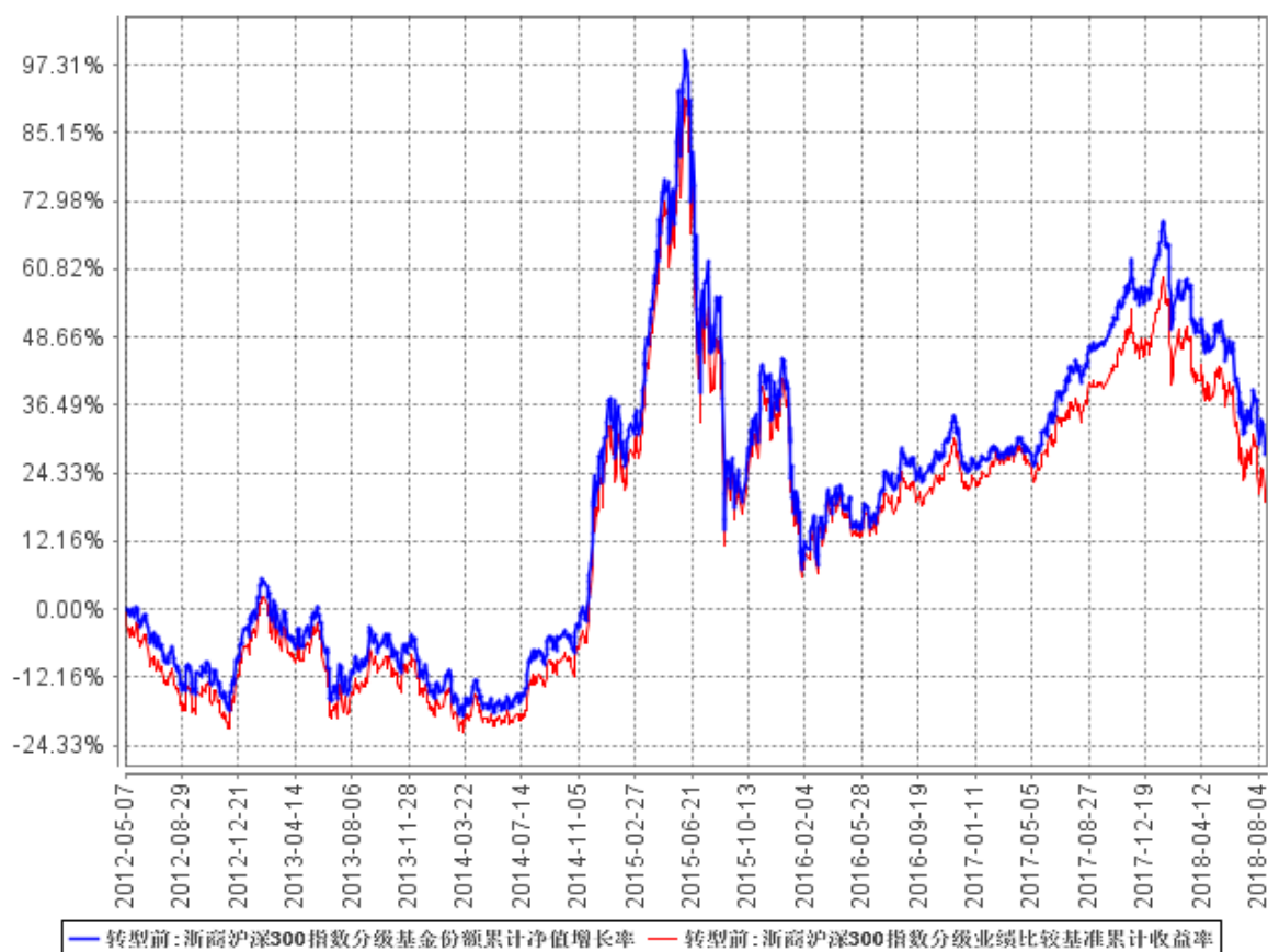
浙商沪深300指数分级基金份额累计净值增长率与同期业绩比较基准收益率的历史走势对比图